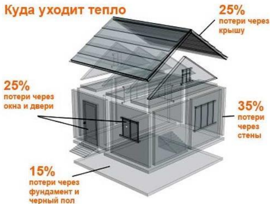
Рис.2 – Структура потерь тепловой энергии через ограждающие конструкции

Безусловно, это приблизительное соотношение теплотерь, но оно отражает значимость каждого из них. Из рисунка видно, что помимо наружных стен, крыши и подвала, теплозащита которых, как раз и регламентируется СП, много тепла уходит через окна и расходуется на нагрев свежего наружного воздуха в системе вентиляции и (или) неорганизованного притока. Вот в этих двух последних путях теплотеря (окна и вентиляция) и находится основной потенциал уменьшения удельного расхода тепловой энергии. Для того, чтобы использовать этот потенциал, необходимо хорошо изолировать оконные и дверные проемы, устранить «мостики холода» и чрезмерную инфильтрацию наружного воздуха в стыковых соединениях, а также правильно организовать воздухообмен в помещениях.