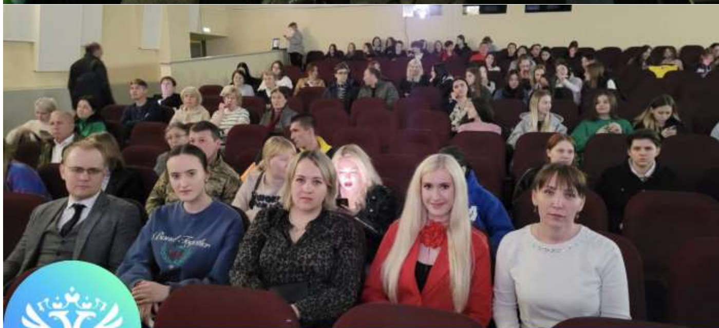
Сотрудники самарского Росреестра побывали на премьере фильма о Донбассе