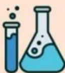
МЕДИЦИНСКИЕ и ЖИДКИЕ ОТХОДЫ