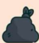
СТРОИТЕЛЬНЫЕ ОТХОДЫ, КИРПИЧИ