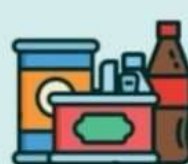
ПЛАСТМАССУ и КОНСЕРВНЫЕ БАНКИ