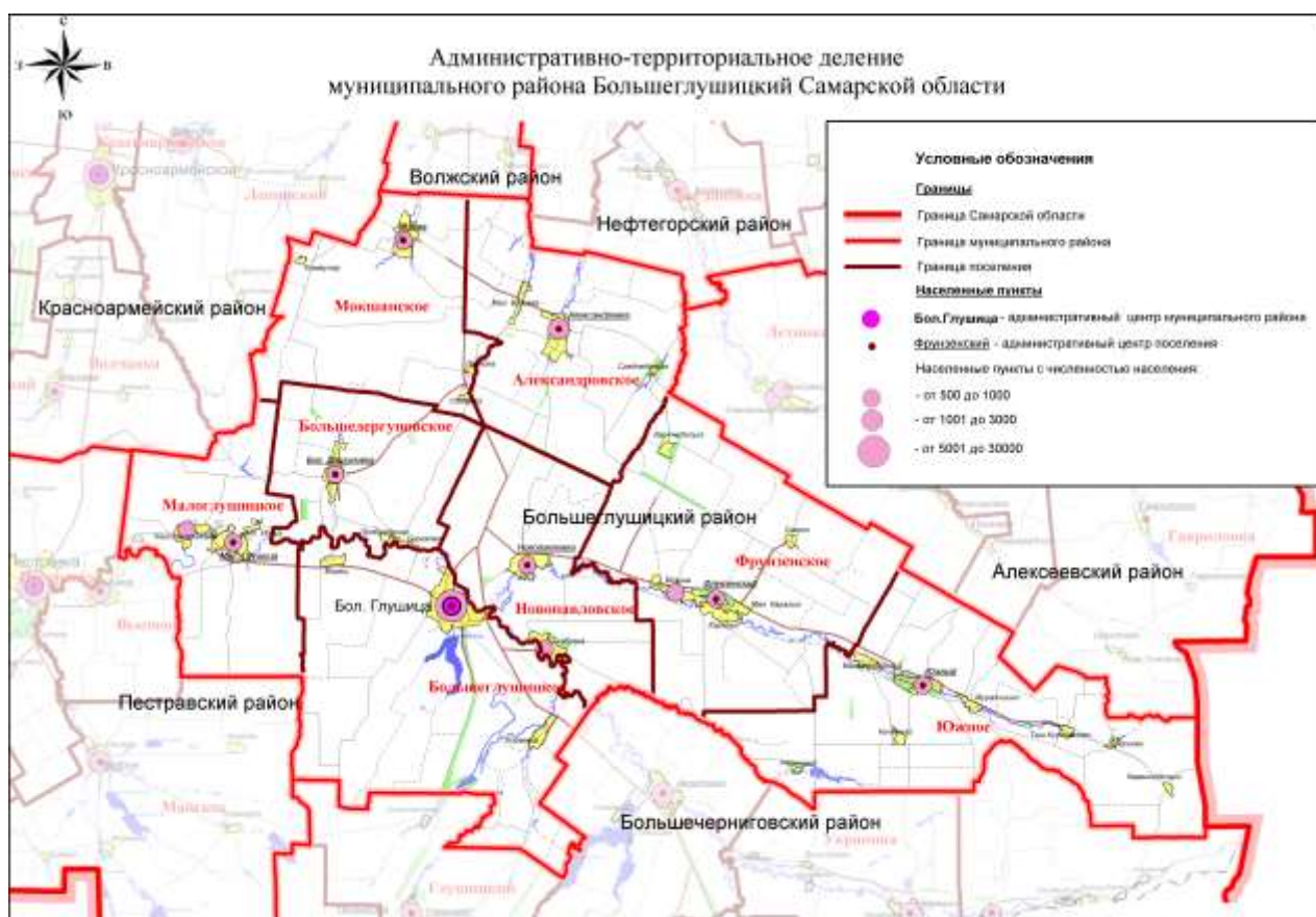
Рис.1 Административно-территориальное деление муниципального района Большеглушицкий Самарской области.

Административно-территориальное деление муниципального района Большеглушицкий Самарской области представлено на рисунке 1.