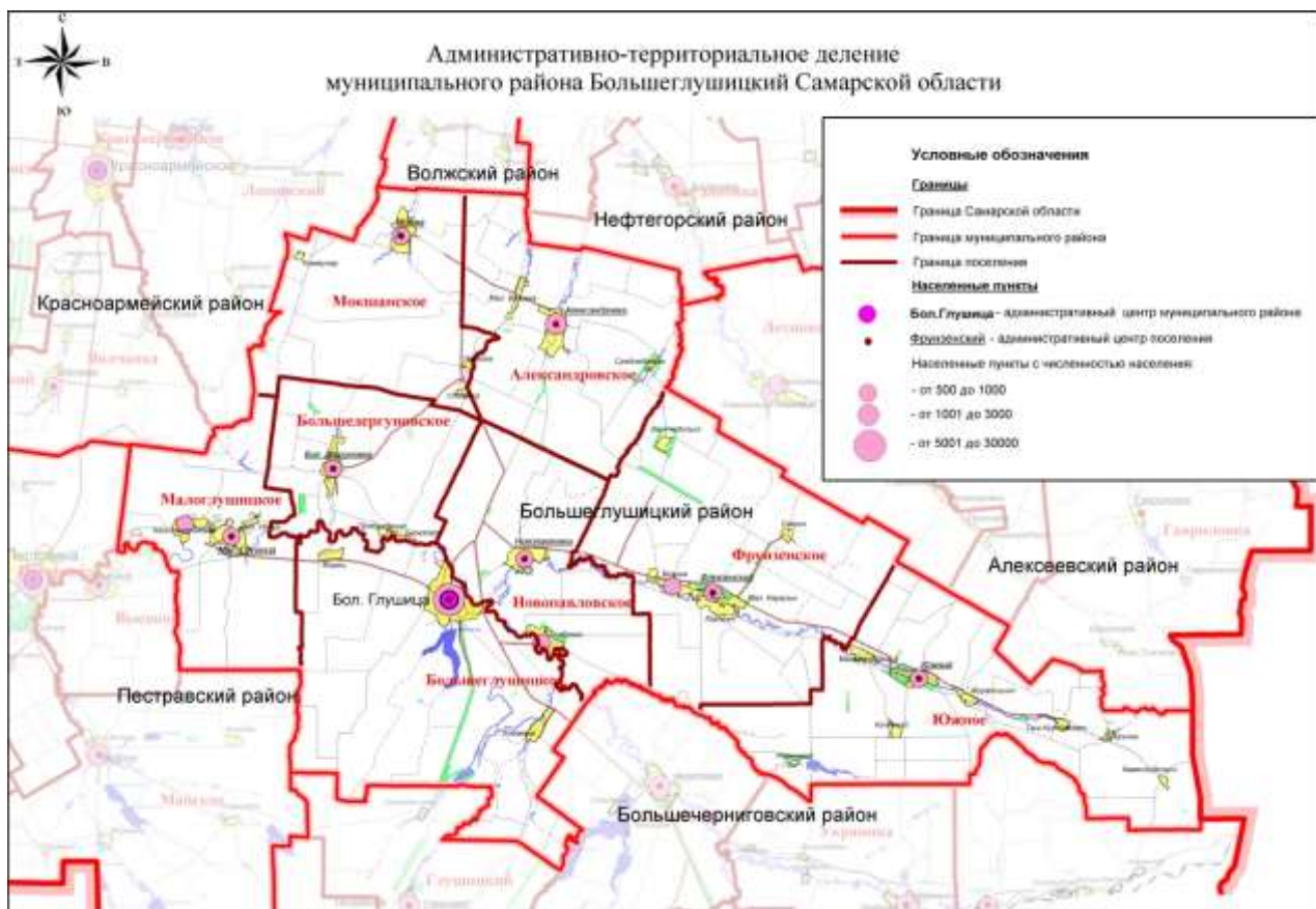
Рис.1 Административно-территориальное деление муниципального района Большеглушицкий Самарской области.

Сельское поселение Южное расположено в юго-восточной части Самарской области. Расстояние от поселка Южный до районного центра составляет 55 км, до областного центра 140 км.