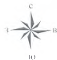
Схема расположения земельного участка на кадастровом плане территории