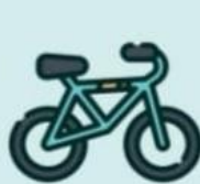
ВЕЛОСИПЕДЫ и САМОКАТЫ