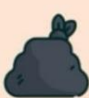
СТРОИТЕЛЬНЫЕ ОТХОДЫ, КИРПИЧИ