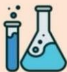
МЕДИЦИНСКИЕ и ЖИДКИЕ ОТХОДЫ