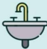
РАКОВИНЫ и КРАНЫ