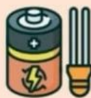
ЛАМПЫ, АККУМУЛЯТОРЫ и БАТАРЕИ