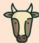
ШКУРЫ КРС и ТРУПЫ ЖИВОТНЫХ