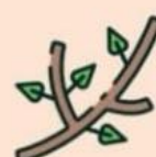
БОТВА и ВЕТКИ