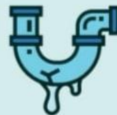
ОТХОДЫ ТЕКУЩЕГО РЕМОНТА