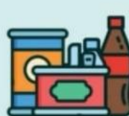
ПЛАСТМАССУ и КОНСЕРВНЫЕ БАНКИ