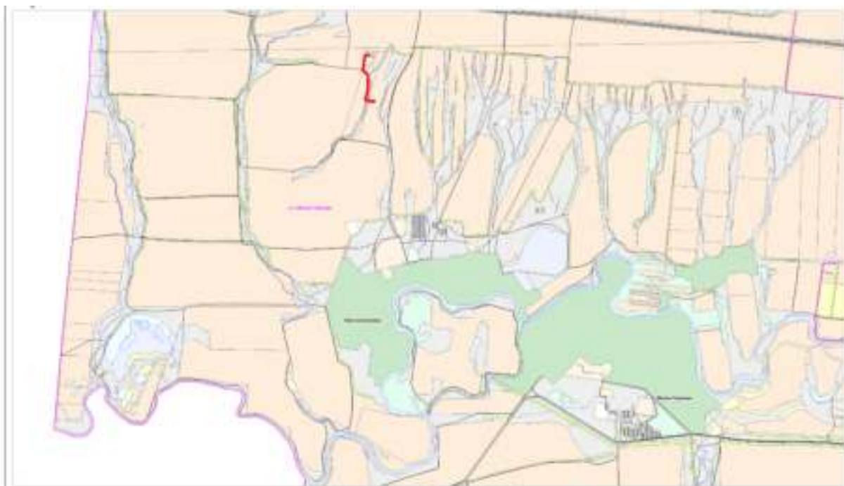
Рисунок 1- Обзорная схема района работ

В описываемом регионе существенное влияние оказывают ветры Сибирского антициклона. Среднегодовая скорость ветра составляет 3,6 м/с.