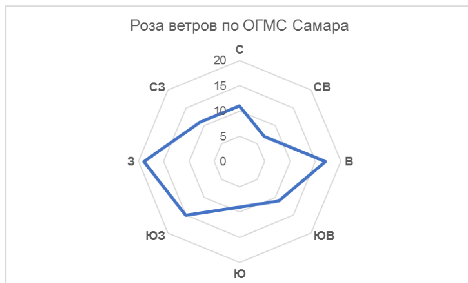
Примечание – Одно деление шкалы соответствует 5 % повторяемости Рисунок 1.1 - Годовая повторяемость направлений ветра, %

Общая циркуляция атмосферы обуславливает преобладание в течение года в исследуемом районе ветров южной четверти (по данным метеостанции Самара). В зимний период, когда над территорией располагается отрог Сибирского антициклона, повторяемость ветров южного и восточного направлений составляет 17 - 34%. Летом наибольший процент повторяемости приходится на северные и северо-западные ветры (16 % повторяемости).