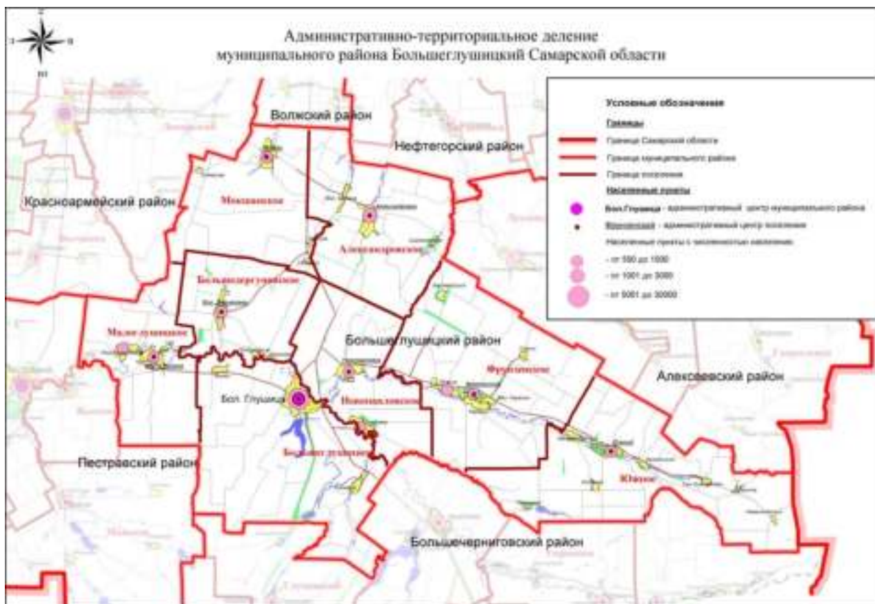
Рис.1 Административно-территориальное деление муниципального района Большеглушицкий Самарской области.

Сельское поселение Мокша расположено на севере муниципального района Большеглушицкий Самарской области.