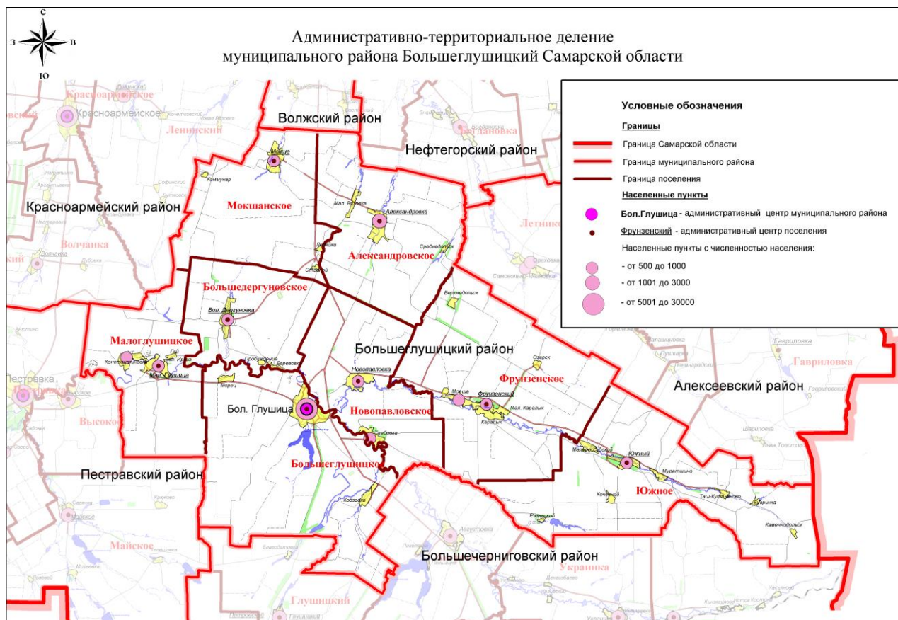
Рис.1 Административно-территориальное деление муниципального района Большеглушицкий Самарской области.

Сельское поселение Мокша расположено на севере муниципального района Большеглушицкий Самарской области.