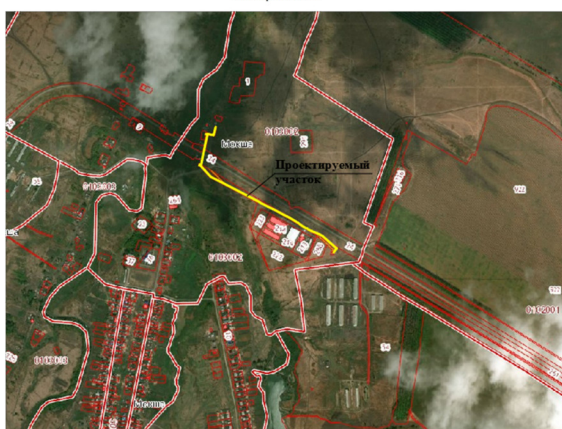
Схема красных линий

Красные линии - линии, которые обозначают существующие/планируемые (изменяемые, вновь образуемые) границы территорий общего пользования, границы земельных участков, на которых расположены линии электропередачи, линии связи (в том числе линейно-кабельные сооружения), трубопроводы, автомобильные дороги, железнодорожные линии и другие подобные сооружения (далее - линейные объекты); (в ред. Федерального закона от 31.12.2005 № 210-ФЗ)