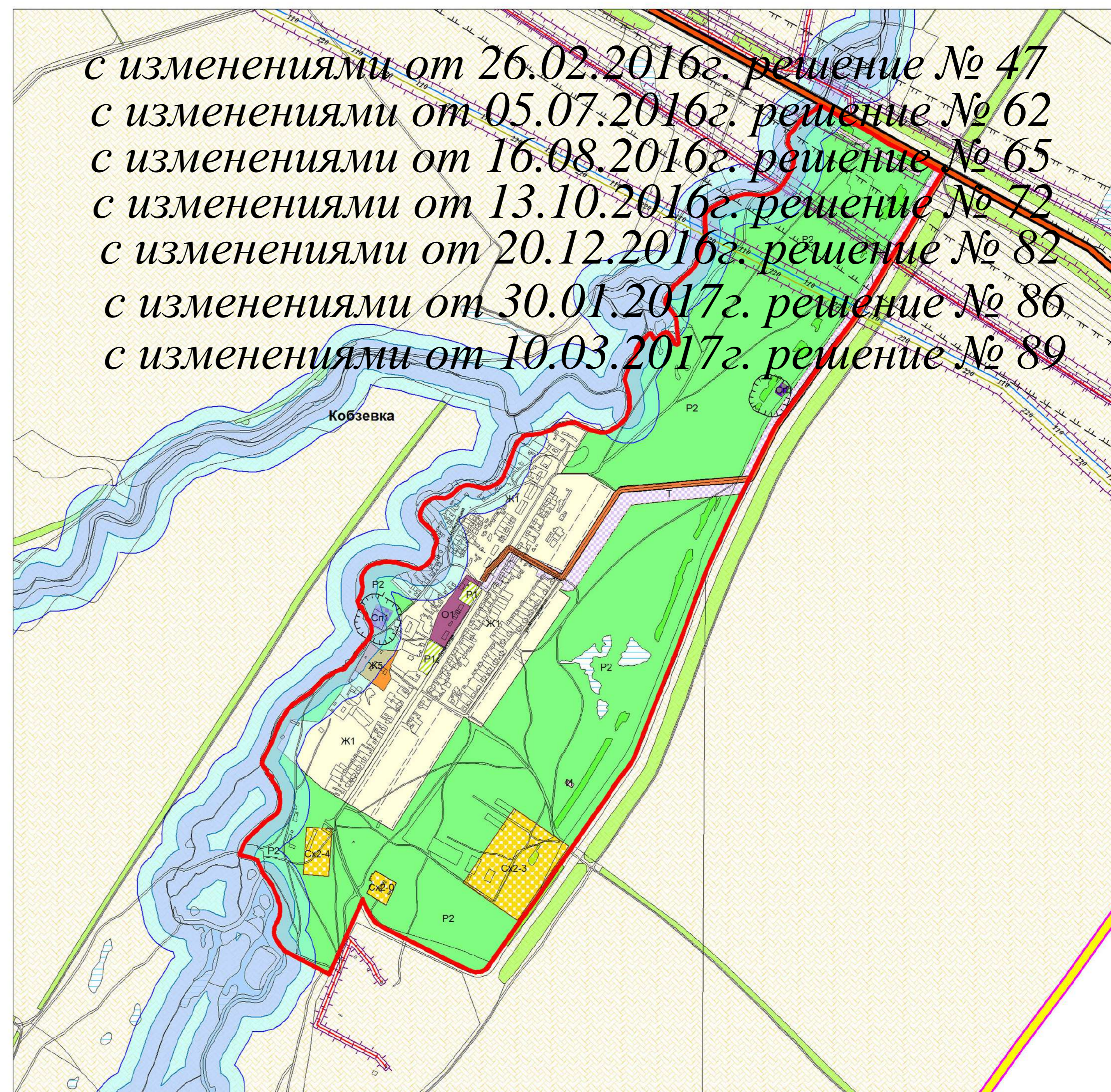
Карта градостроительного зонирования п. Морец муниципального района Большеглушицкий Самарской области