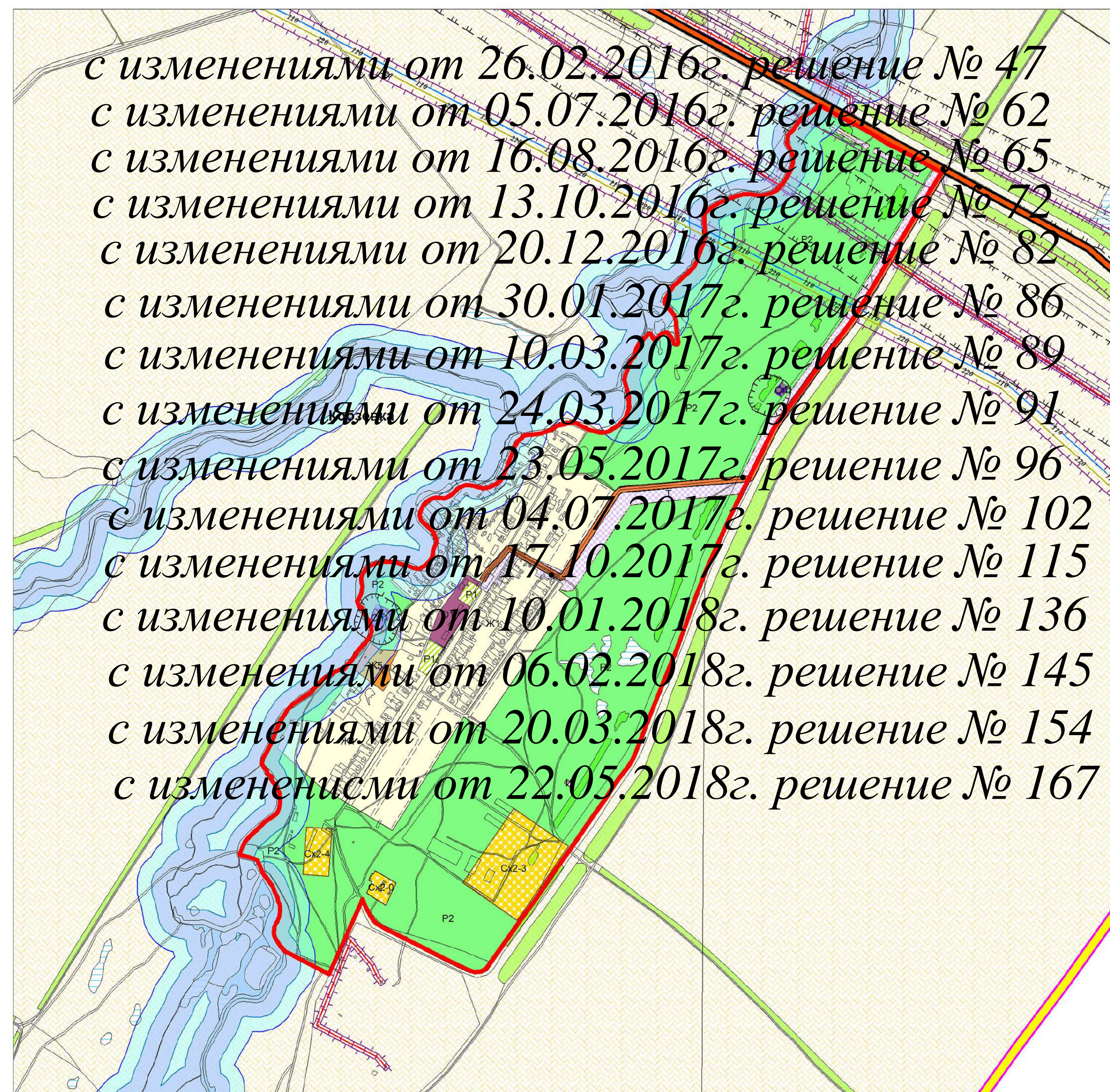
Карта градостроительного зонирования п. Морей муниципального района Большеглушицкий Самарской области