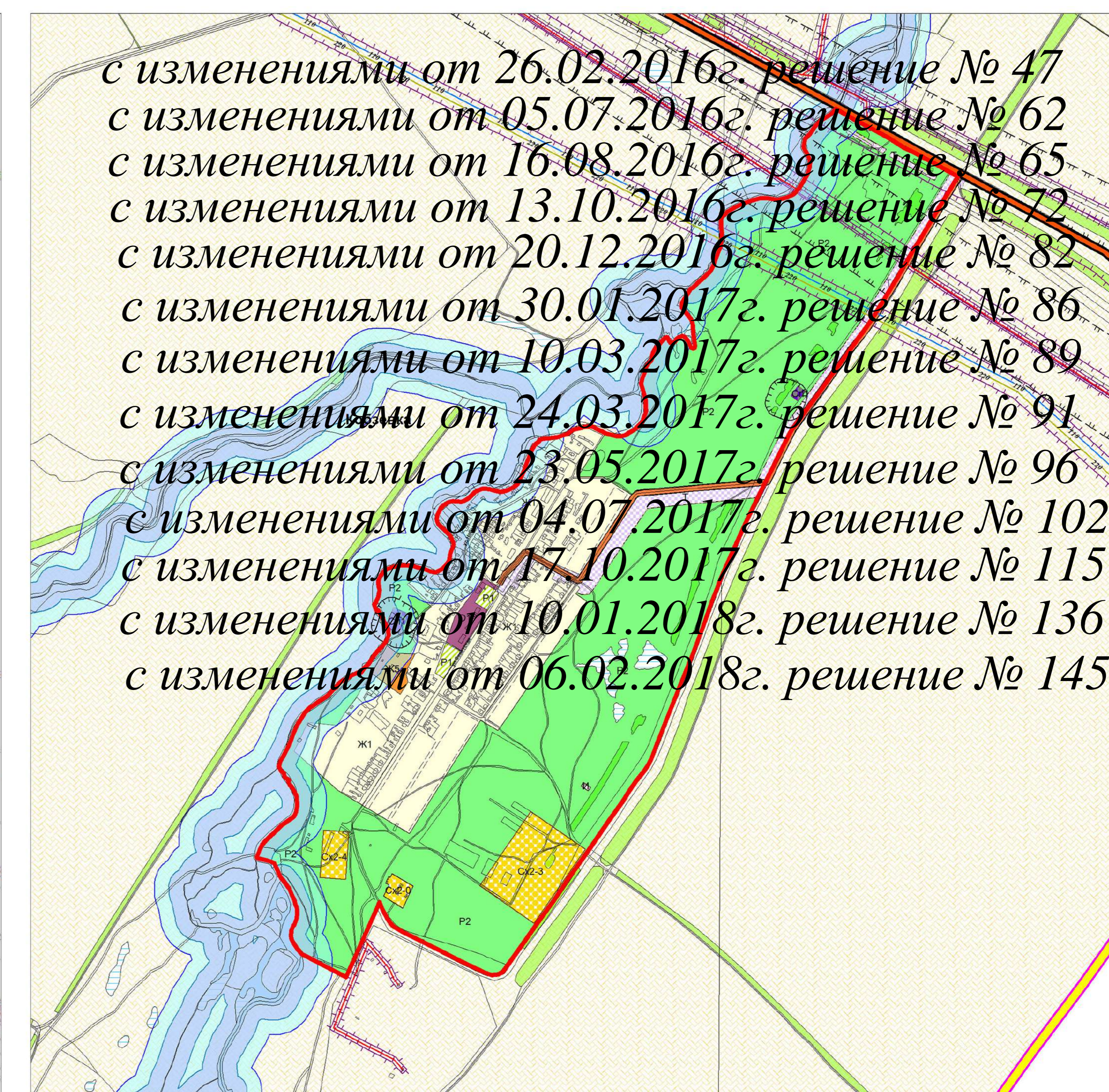
Карта градостроительного зонирования п. Морец муниципального района Большеглушицкий Самарской области