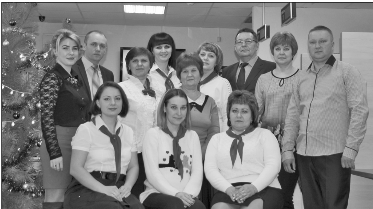
■ Коллектив МБУ "Большеглушицкий МФЦ".

НАКАНУНЕ ПЯТИЛЕТНЕГО ЮБИЛЕЯ ПОДВОДИТ ИТОГИ ДЕЯТЕЛЬНОСТИ МБУ "БОЛЬШЕГЛУШИЦКИЙ МФЦ" ЕГО РУКОВОДИТЕЛЬ В.П.КРЮЧИН: