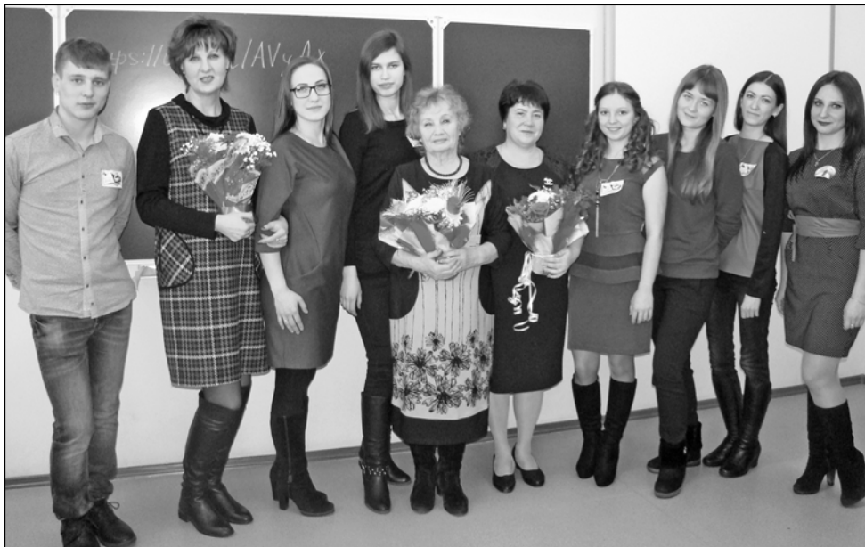
Вечер встречи выпускников в Большеглушицкой школе №2

Ежегодно, в первую субботу февраля, для выпускников распахиваются двери школ района. Вечер встречи школьных друзей всегда волнительный и долгожданный. Счастливые глаза, слезы радости, теплые воспоминания... Вот и мы решили встретиться с некоторыми из выпускников, чтобы вновь окунуться в детство