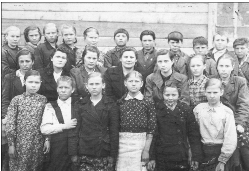
■ Коллектив учащихся и учителей Александровской семилетней школы