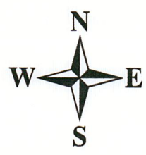
Схема организации улично-дорожной сети и схема движения транспорта на соответствующей территории для строительства объекта АО "РИТЭК" «Обустройство скважины № 454 Крюковского месторождения» в границах сельского поселения Малая Глушица муниципального района Большеглушицкий Самарской области