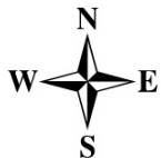
Схема организации улично-дорожной сети и схема движения транспорта на соответствующей территории для строительства объекта АО "РИТЭК" «Обустройство скважин №№ 1, 14, 15, 16 Альпийского месторождения» в границах сельского поселения Малая Глушица муниципального района Большеглушицкий Самарской области