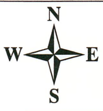
Схема использования территории в период подготовки планировки территории для строительства объекта АО "РИТЭК" «Обустройство скважины № 110 Комаринского месторождения» в границах сельского поселения Большая Глушица муниципального района Большеглушицкий Самарской области