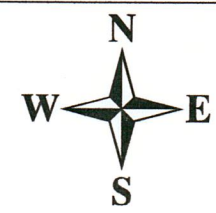
Схема использования территории в период подготовки планировки территории для строительства объекта АО "РИТЭК" «Обустройство скважины № 110 Комаринского месторождения» в границах сельского поселения Большая Глушица муниципального района Большеглушицкий Самарской области