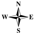
Схема использования территории в период подготовки планировки территории для строительства объекта АО "РИТЭК" «Обустройство скважин №№ 1,14,15,16 Альпийского месторождения» в границах сельского поселения Малая Глушица муниципального района Большеглушицкий Самарской области