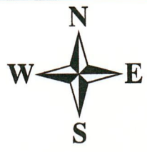
Схема организации улично-дорожной сети и схема движения транспорта на соответствующей территории для строительства объекта АО "РИТЭК" «Обустройство сваяжины № 110 Комаринского месторождения» в границах сельского поселения Большая Глушица муниципального района Большеглушицкий Самарской области