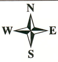
Схема границ зон с особыми условиями использования территории для строительства объекта АО "РИТЭК" «Обустройство скважины № 110 Комаринского месторождения» в границах сельского поселения Большая Глушица муниципального района Большеглушицкий Самарской области