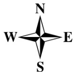
Схема границ зон с особыми условиями использования территории для строительства объекта АО "РИТЭК" «Обустройство скважин №№ 1, 14, 15, 16 Альпийского месторождения» в границах сельского поселения Малая Глушица муниципального района Большеглушицкий Самарской области