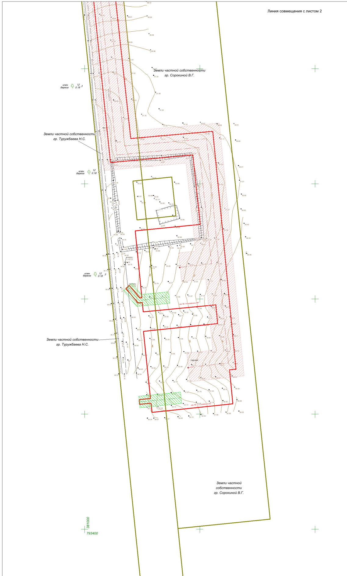
Схема расположения листов