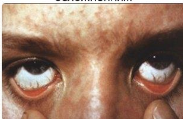
Фото наглядно это демонстрируют. Тело больного зудит и чешется. Краснуха, ветрянка, корь – инфекционные болезни, чаще всего встречающиеся у детей. Тем не менее, взрослый человек тоже может ими заболеть. Намного тяжелее переносится в этом случае болезнь корь. Фото взрослых зараженных мало чем отличаются от изображений проявления заболевания у детей, но самочувствие ребенка на порядок лучше в течение всего периода болезни.

Достаточно часто корь приводит к серьезным осложнениям