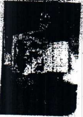
Специалисты подразделений производственной медицины