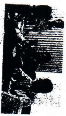
Специалисты в области управления персоналом