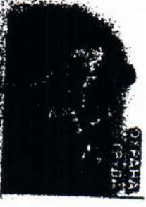
Специалисты в области управления персоналом